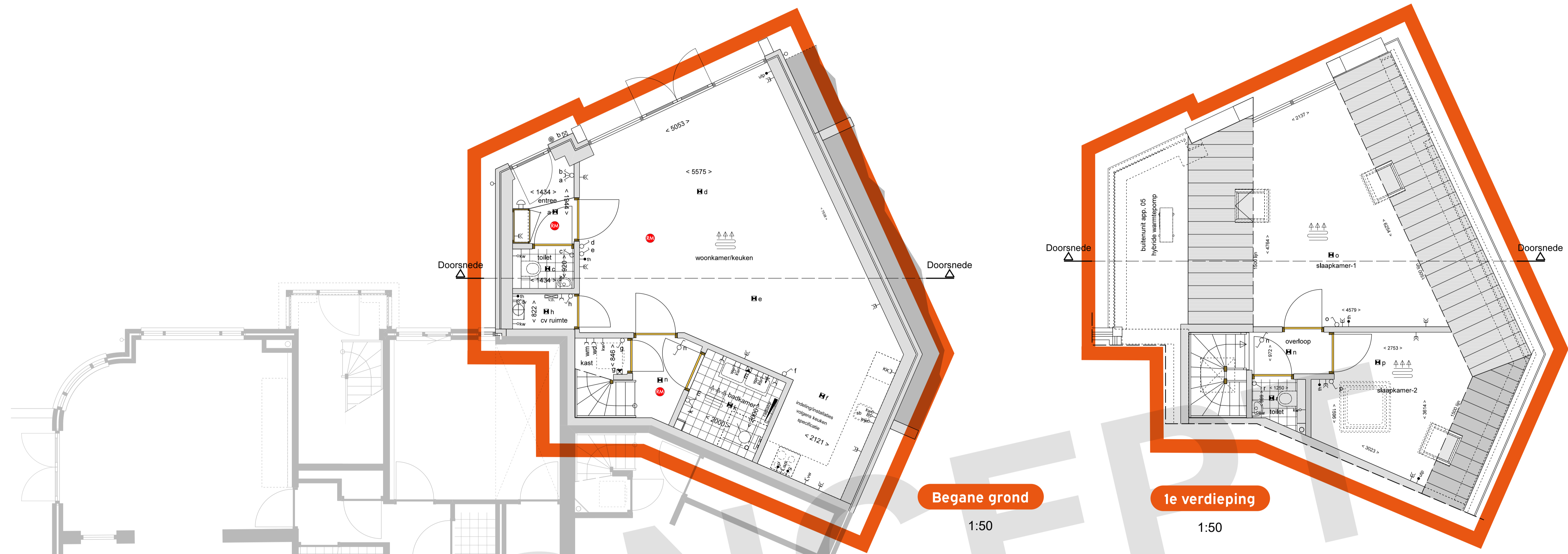
Begane grond 1:50